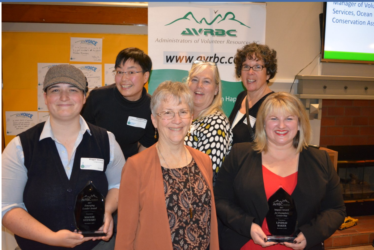
Gestionnaires de bénévoles en Colombie-Britannique