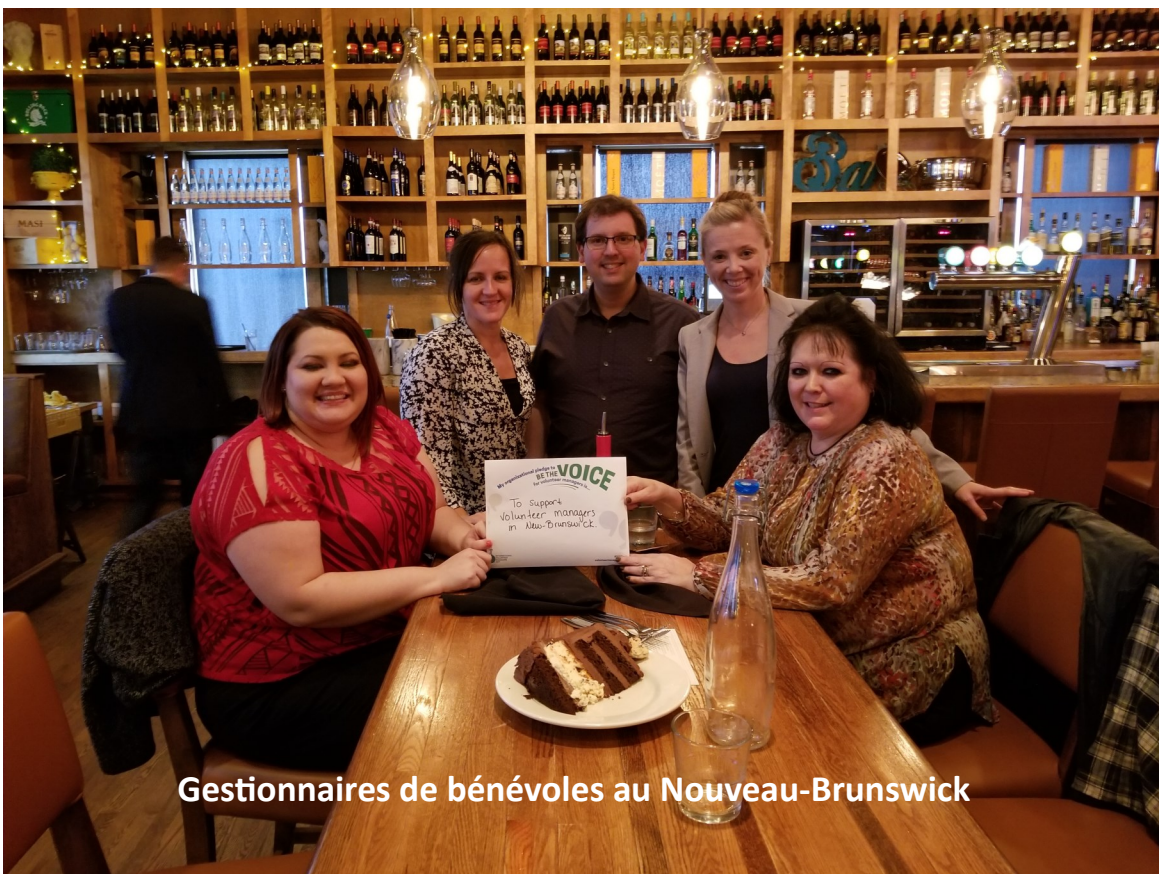
Gestionnaires de bénévoles au Nouveau-Brunswick