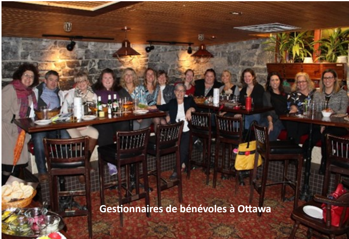
Gestionnaires de bénévoles à Ottawa